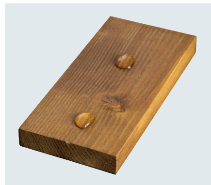
SÄTTIGER XYLOGUARD HYDRO

Nach mehr als 2000 Stunden UVA-Bestrahlung bleiben die Farbtöne unserer Lasur stabil und bleichen nicht aus, gleich auf welchem Holz. Der Film zeigt selbst bei kräftigen Farben keine Anzeichen von Rissbildung.